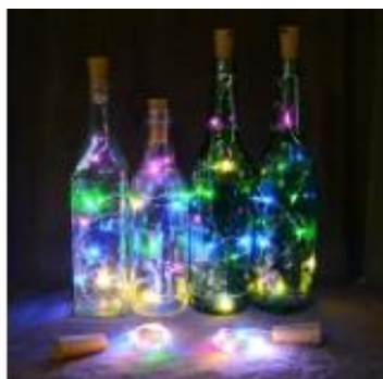
Décoration lumineuse bouteille led