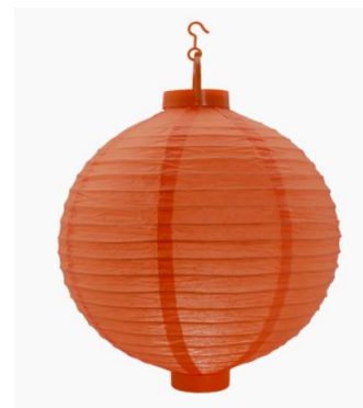
Décoration lampion led (orange, rouge ou vert en papier de riz)