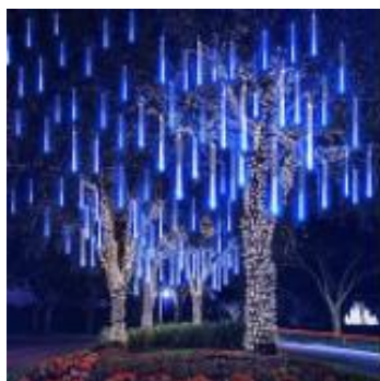
Décoration lumineuse arbre (hauteur 0,5m)