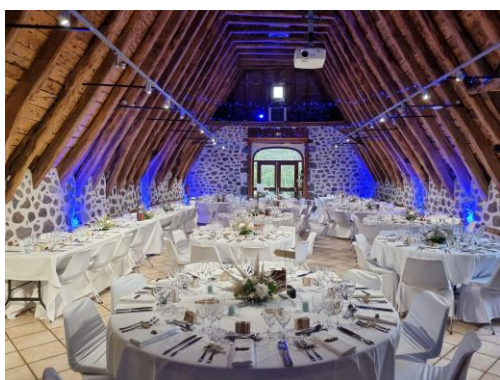
Ambiance chaude Pavillon au Roy diner (led étoilé et éclairage murs)