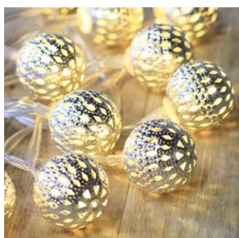
Décoration lumineuses boules Argent ou Cuivre (10 boules sur 1,5m)