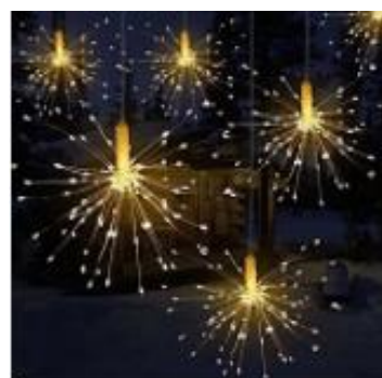
Décoration lumineuse étoile tombante (Flexible 0,3m)